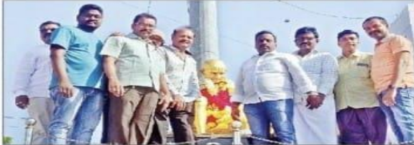
ధర్మవరంలో గాంధీ విగ్రహానికి పూలమాలలు వేస్తున్న అహోపా సభ్యులు