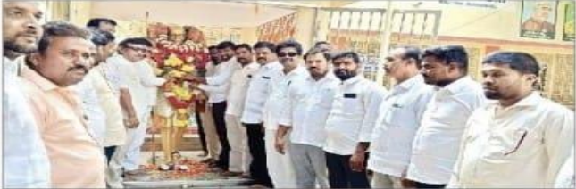
గాంధీ విగ్రహానికి పూలమాలలు వేస్తున్న వైఎస్సార్‌సీపీ నాయకులు