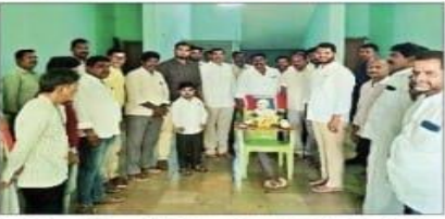
ముద్దిగుట్టలో గాంధీకి నివాళులు అర్పిస్తున్న దృశ్యం